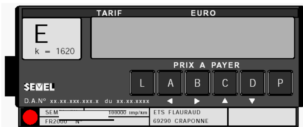
FRD2 du taximètre SEMEL type FR 2001