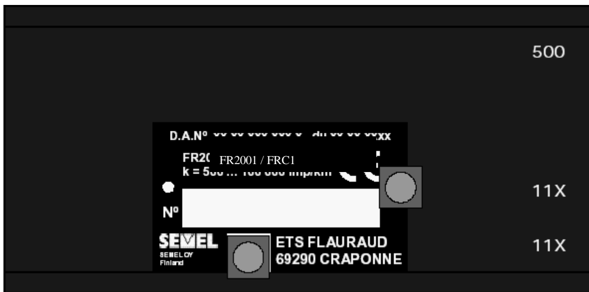
FRC1 du taximètre SEMEL type FR 2001